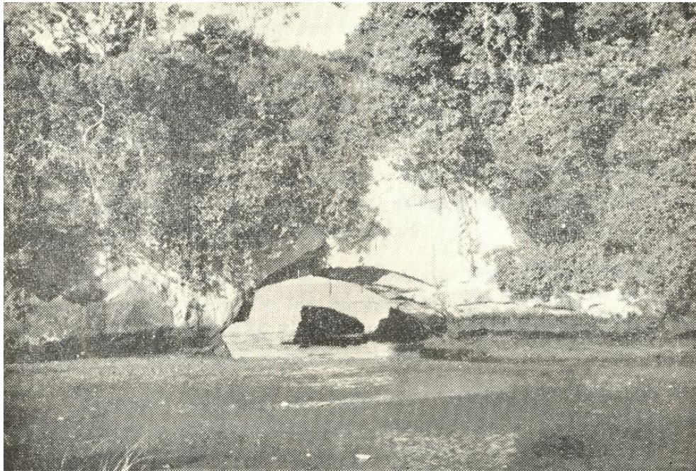
Tumaco-Arco del Quesillo, horadación marina de la colina de "El Morro", único relieve de la isla de este nombre.

Artículo del Boletín de la Sociedad Geográfica de Colombia Número 59, Volumen XVI Tercer Trimestre de 1958