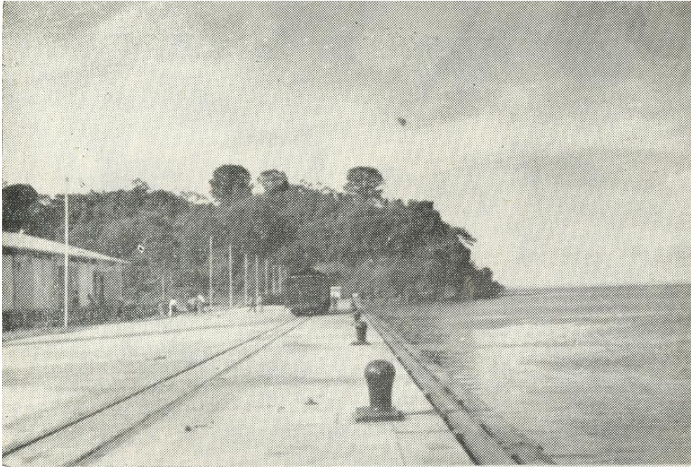
Tumaco – Terminal marítima y ferroviario en la isla de “El Morro”. Muelle de 310 metros de largo por 14 de ancho. Parte de la colina de “El Morro” donde se halla el faro del puerto.