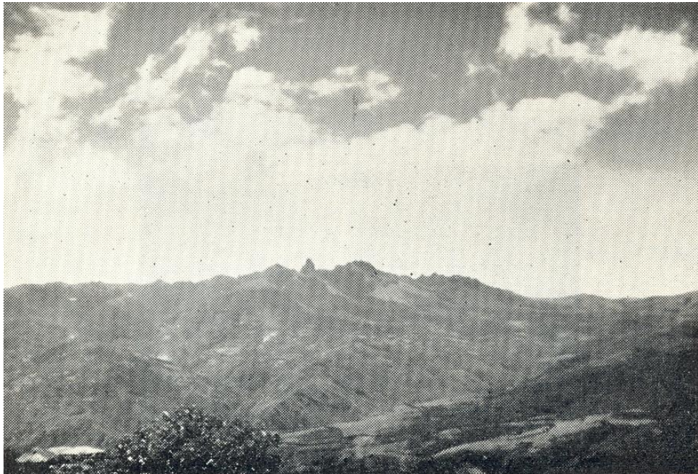
Cerro Gualcalá o Mallana (4.200 mts), uno de los más importantes espectáculos que se contemplan entre Pasto y Tumaco. El “Dedo de Dios”.