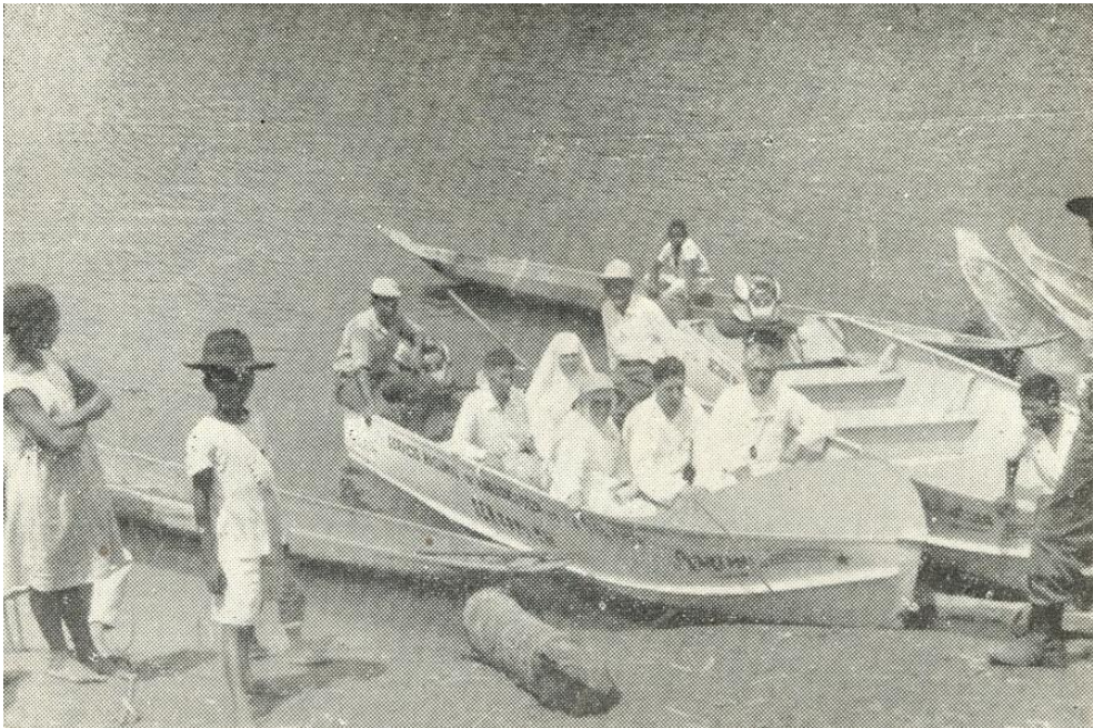
No se anima ya el poético Telembí con las sirenas de los barcos de vapor que hasta tiempos recientes movían el comercio entre Tumaco y Barbacoas. Surcan hoy sus aguas la canoa y la lancha de gasolina. Pangas y piraguas... en el puerto de San José.