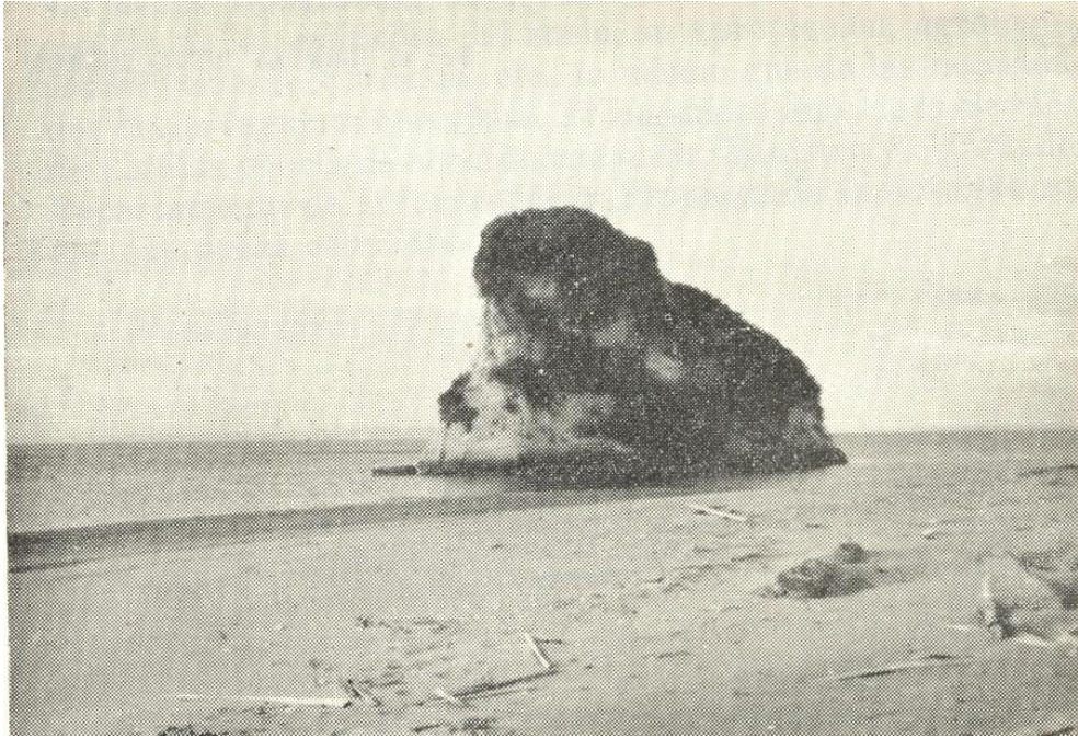
El Quesillo – Fragmento de la colina de “El Morro”, separado por la erosión. La playa contigua es uno de los balnearios naturales de Tumaco.