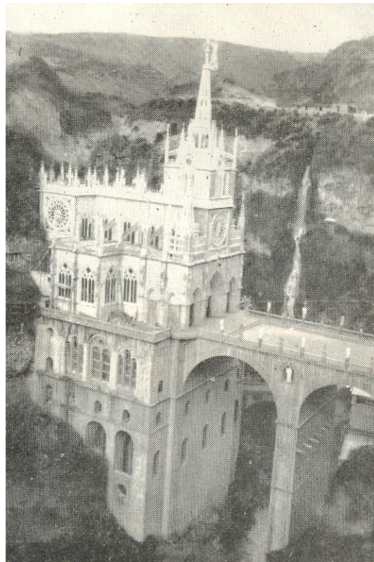
Río Guáitara y santuario de Las Lajas. Al interés de la salvaje topografía del lugar se une el fervor religioso para hacer de Las Lajas un concurrido centro de turistas y peregrinos.