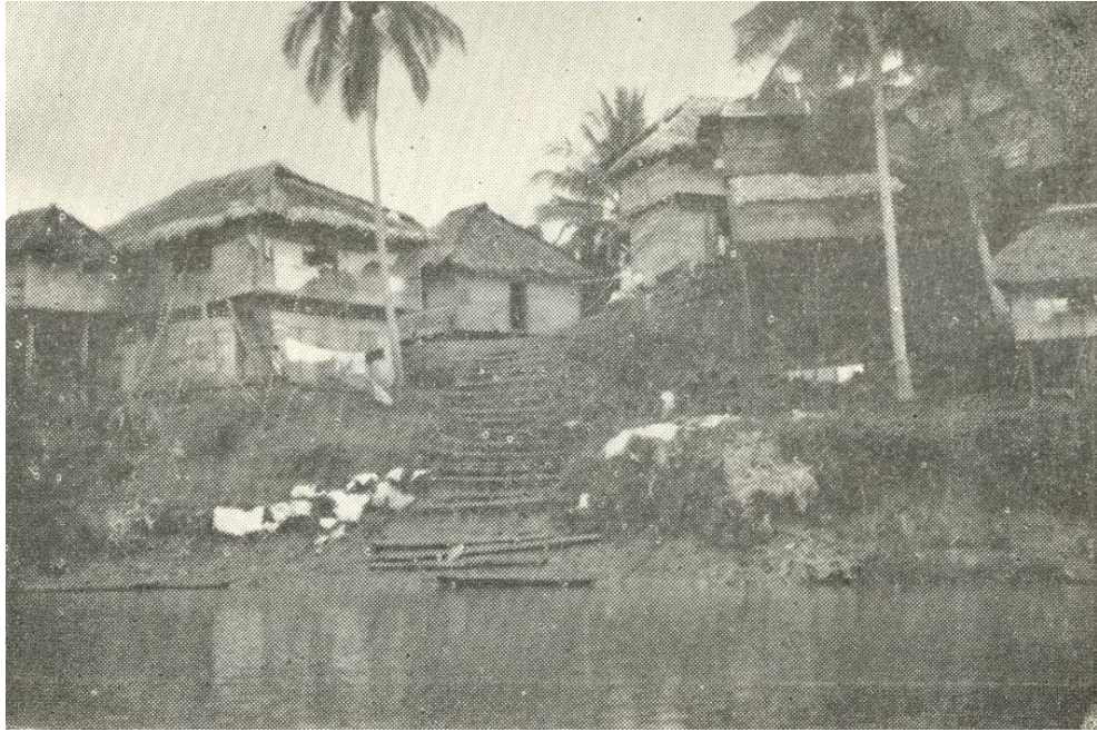
San Antonio – Caserío de las riberas del Telembí cerca de su desembocadura en el Patía.