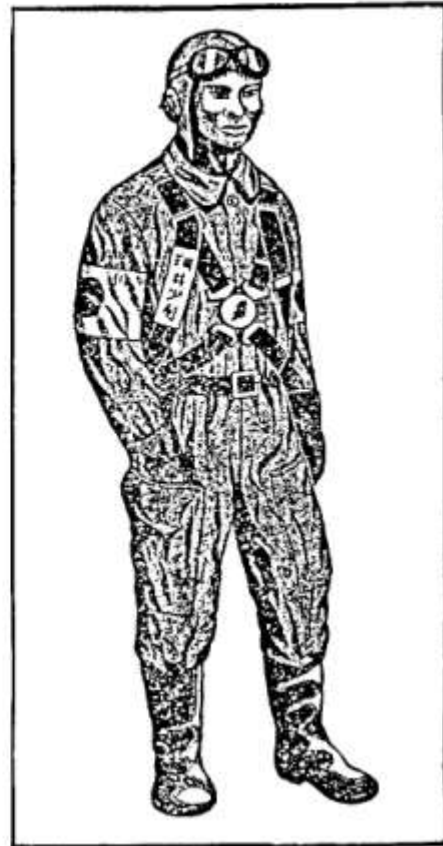
TRAJE DE VUELO KAMIKAZE