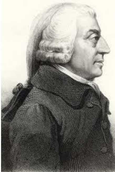
Adam Smith 1723-1790