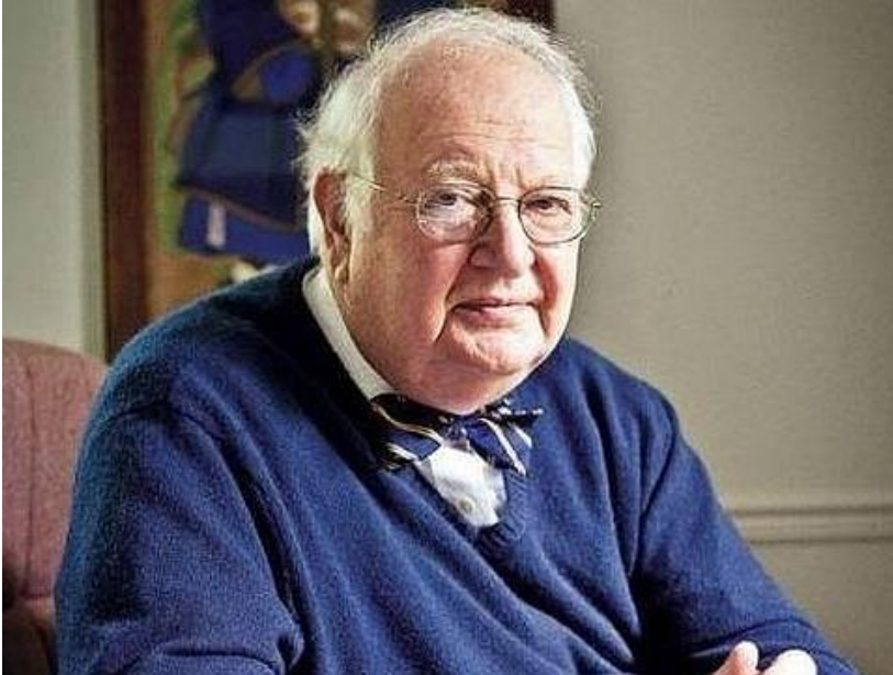
Angus Deaton 2015

Es impreciso lo que la masa de ricos aporta a la sociedad