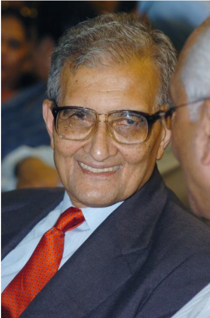
Amarty sen 1998

Es más importante medir el PIB y conocer el bienestar de las personas