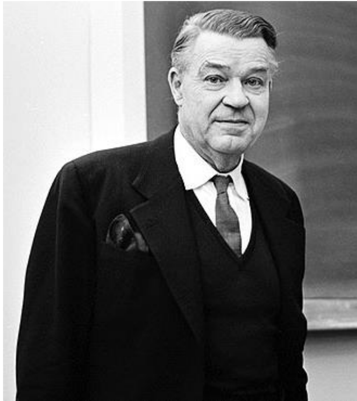
Gunnar Myrdal año 1974

“Para superar el subdesarrollo hay que garantizar la igualdad de oportunidades a todas las personas”