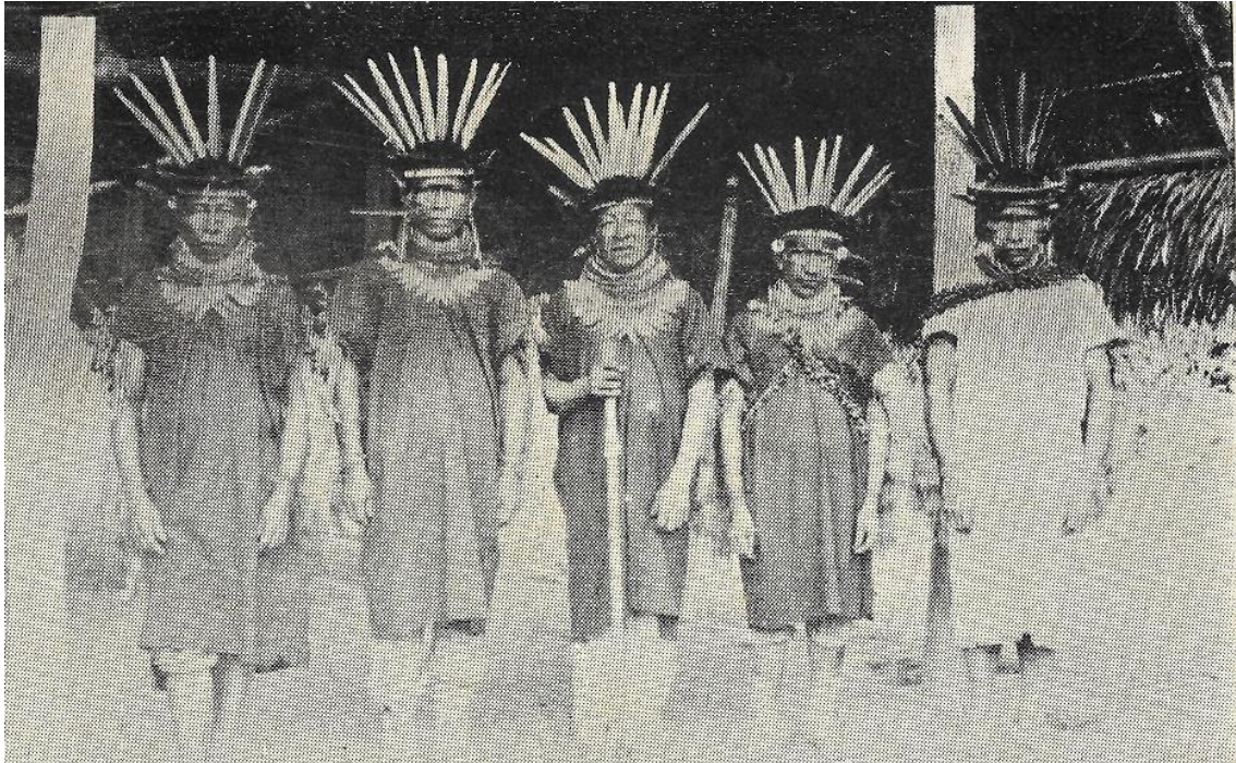
Indios de Curiplaya en traje de fiesta.