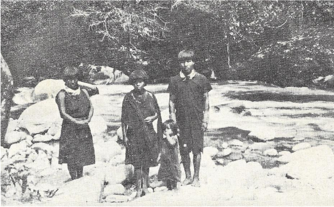
Indios “Niganos”, de los alrededores de Mocoa.