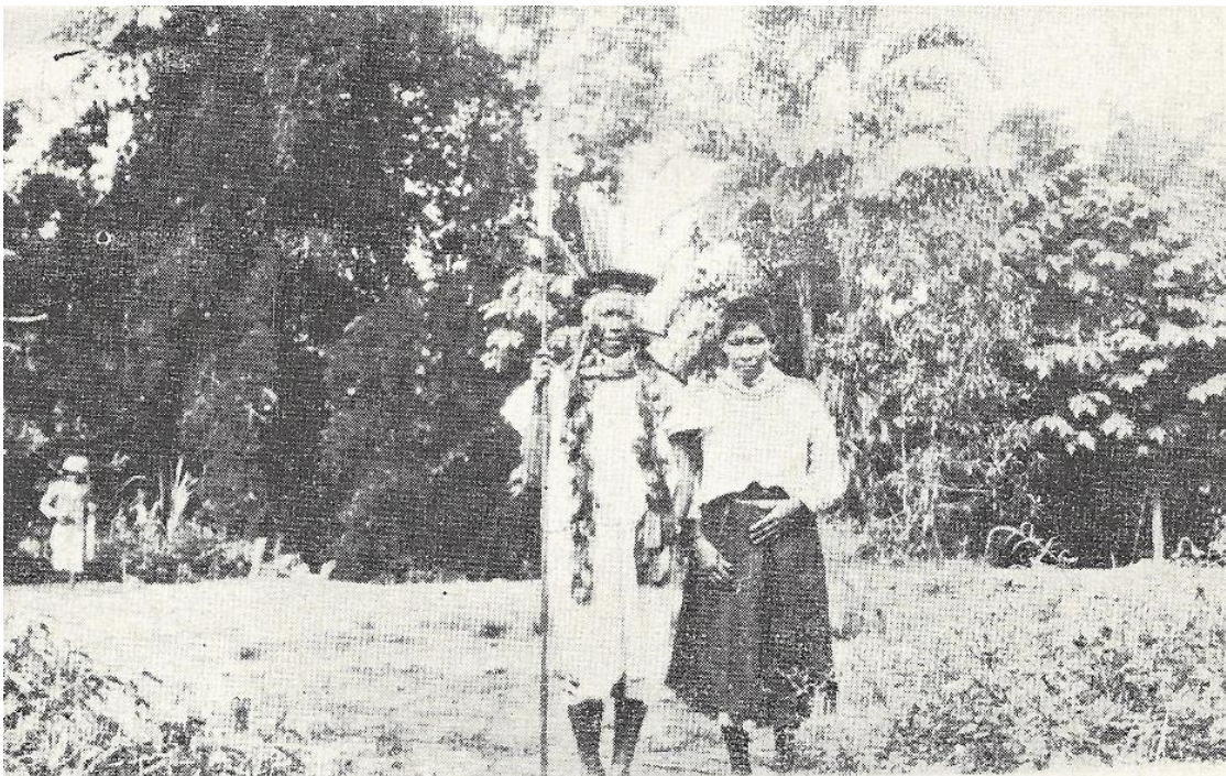
Indios de Curiplaya, en traje de fiesta.