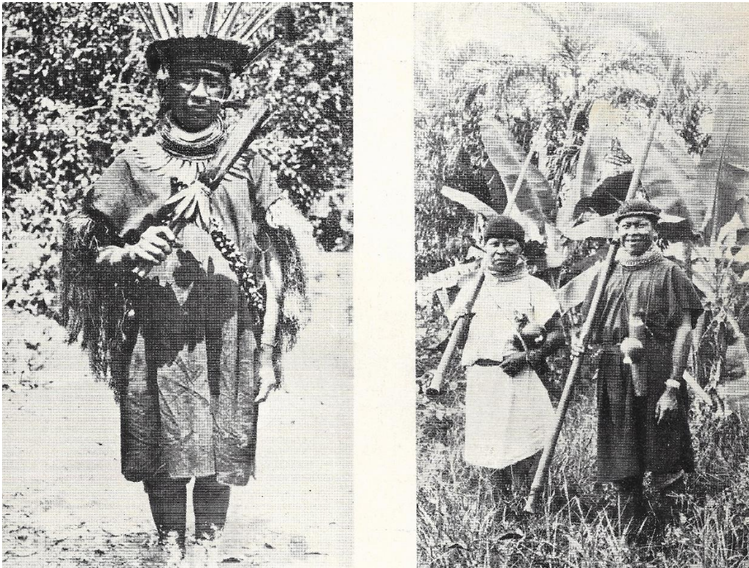
Indio de Curiplaya. Típico del Alto-Putumayo Indios “Sionas” de la “Danta”, en el Putumayo

Orografía e Hidrografía. El sistema orográfico principal se halla formado por el divortium aquarum que separa las aguas del Amazonas de las del Putumayo y que tiene alrededor de 380m. sobre el nivel del mar. El terreno del Trapecio Amazónico colombiano está compuesto de lomas, cuchillas y mesetas, desde unos 15 kilómetros al norte del Amazonas, hasta las cercanías del río Putumayo, siendo notables las mesetas altas situadas en el divorcio mencionado y que se extienden cada una varios kilómetros en el sentido oriente-occidente. Las vegas de las corrientes principales son inundables en el invierno en sectores no muy grandes, 2 kilómetros máximo, a uno de los lados, sin que esto quiera decir que dichas zonas sean continuas, a lo largo de dichas corrientes, pues se encuentran a orillas de las mismas partes altas y barrancos que nunca alcanzan a inundar las aguas máximas.