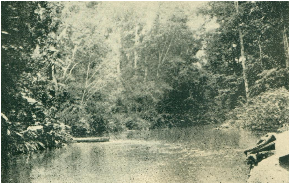
Las cabeceras del río Truandó.