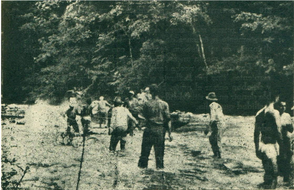
Los rápidos del Truandó