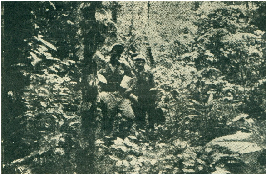
Cruzando la cordillera entre el Truandó y el Océano Pacífico