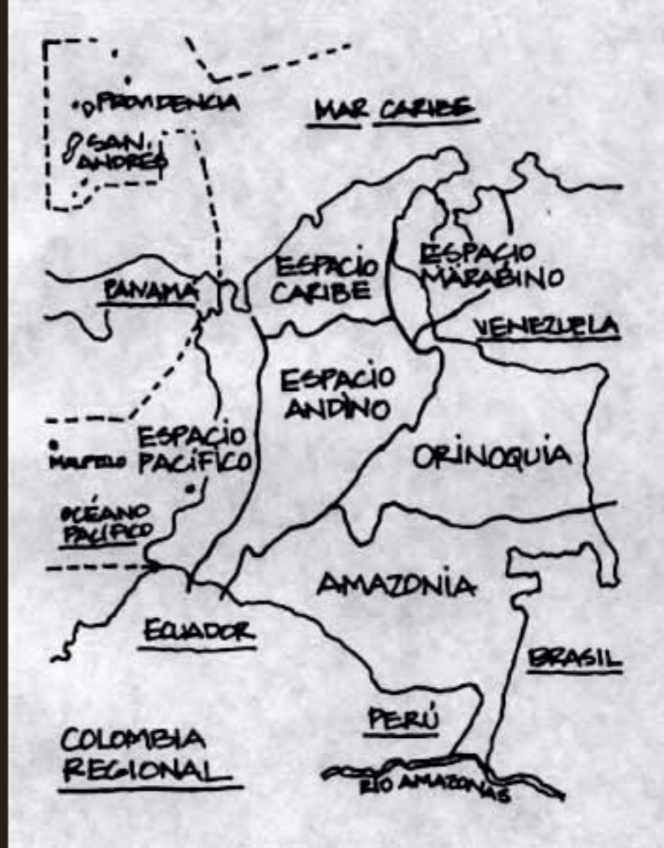
Regiones de Colombia - Dibujo elaborado por Alberto Mendoza.

Sociedad Geográfica de Colombia Para mayor información: www.sogeocol.edu.co