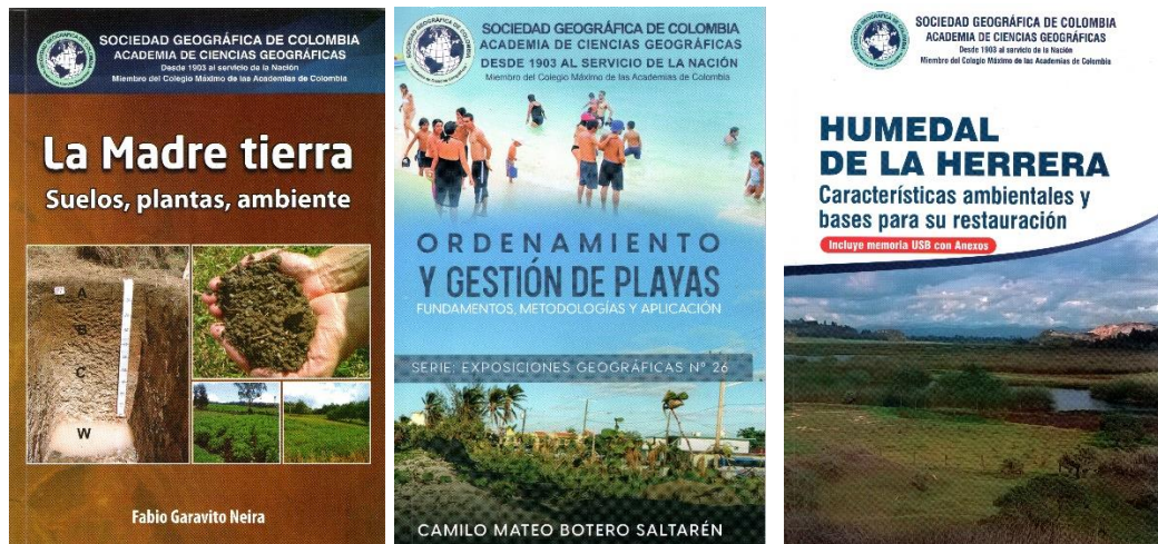
Carátulas de los libros impresos.