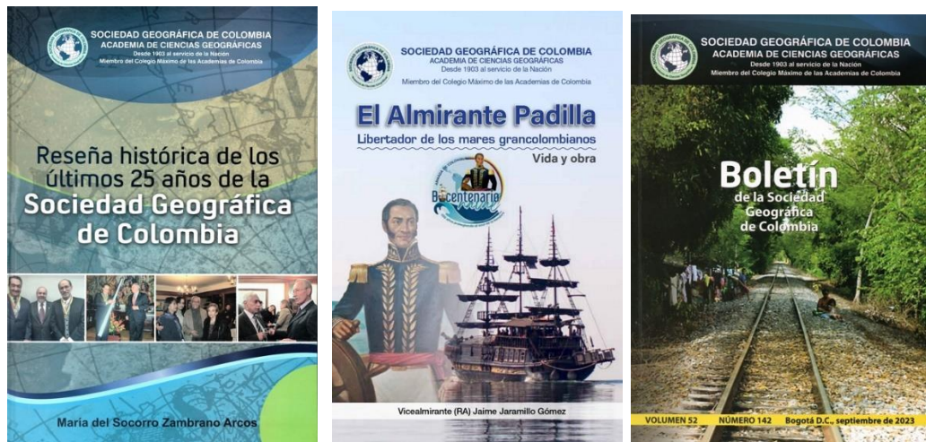
Carátulas de los libros impresos.