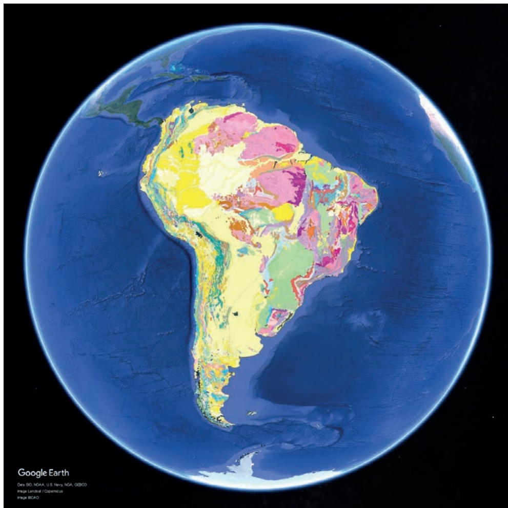
Figura 4. Despliegue del Mapa geológico de Suramérica en Google Earth Fuente: Alcárcel et al. (2023).