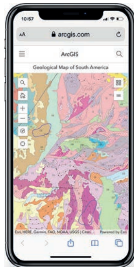
Figura 3. Despliegue del MGSA en ArcGIS Online: los usuarios pueden ver los atributos del mapa haciendo clic sobre los elementos

El MGSA se liberó al público el 26 de noviembre de 2019 en GIS (MXD, style, file geodatabase ), PDF de alta resolución (versión de impresión), PDF de baja resolución (versión web), TIFF, PNG y las fuentes para crear las tramas de las UC. Adicionalmente, se implementó el servicio web y ArcGIS Online. Este último se puede desplegar con facilidad en un dispositivo móvil (figura 3). Para inicios de 2022, se puso a disposición del público la versión en Google Earth del MGSA (figura 4) y el Mapa geológico de Suramérica en relieve a 1:5.000.000 (Gómez et al., 2022) (figura 5).