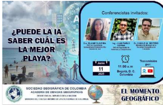
Piezas divulgativas de “El momento geográfico”