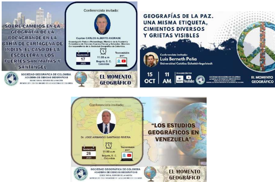
Piezas divulgativas de “El momento geográfico”